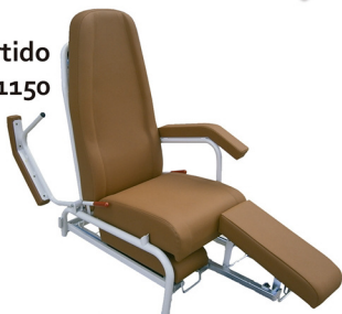
Pie partido Cod. 1150