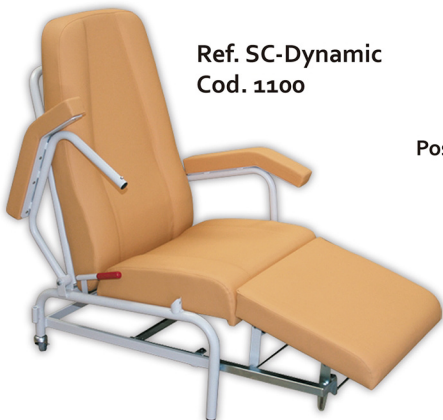
Ref. SC-Dynamic Cod. 1100

Mayor Robustez y Durabilidad. Mayor longitud de Descanso.