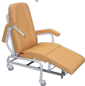
Con ruedas de 80 mm., 2 con freno. Cod. 1110 / Ref. SC-Dynamic+J

antibacteriana y antimicótico. Ignífugo M2 y lavable. Impermeabilidad.